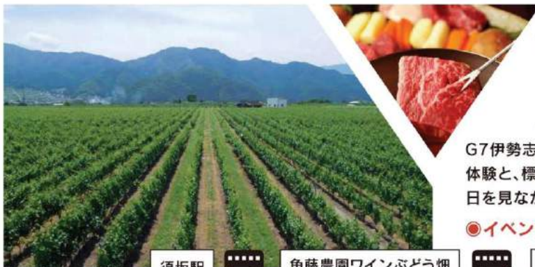
角藤農園ワインぶどう畑